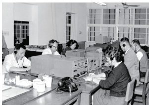
55年3月20日，電務部工作情形。