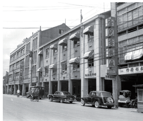
50年8月4日，中央社長達15年的西寧南路舊址。