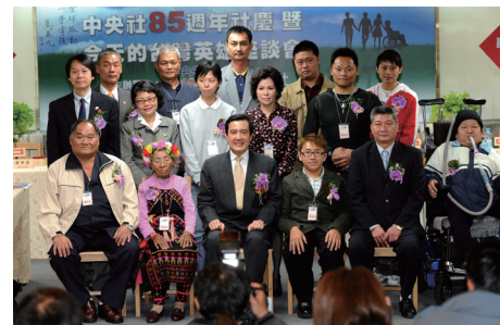
98年4月1日，總統馬英九出席中央社85週年社慶典禮暨《今天的台灣英雄》座談會。