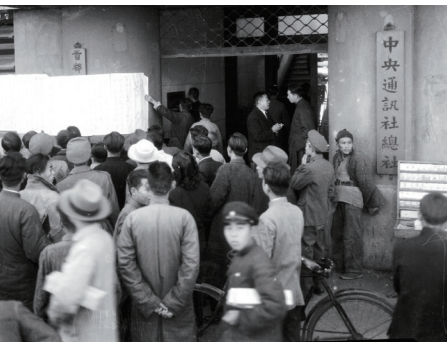
37年11月19日，國共戰爭期間，市民爭看中央社發布徐州大捷號外。