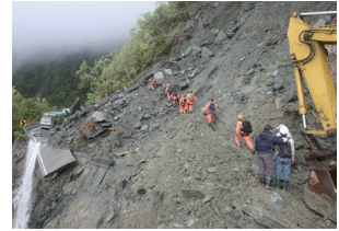
100年6月9日，2011年度卓越新聞獎揭曉，中央社即時新聞「魂斷太平洋岸—台灣蘇花公路坍方攝影紀實」，奪得卓越新聞攝影獎。圖為得獎作品之一。