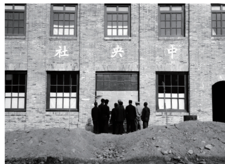
33年寧夏分社設立（攝於36年12月）。