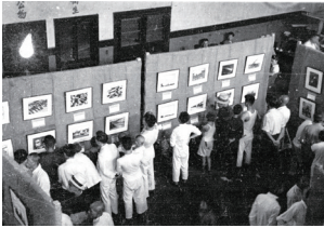
29年9月8日，中央社新聞圖片在漢口展覽。