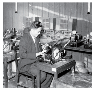
43年，摩爾斯發報機紙帶穿孔。