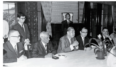
59年8月18日，亞洲新聞通訊社組織第三屆大會與會代表，拜會日本首相佐藤榮作（左三），左為中央社社長馬星野。