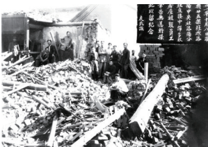
31年10月8日，洛陽分社被炸。