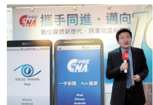
100年7月1日，中央社舉行改制15週年慶，並發表新APP應用程式「一手新聞」和「Focus Taiwan」，中央社社長羅智成在典禮上發表演說。