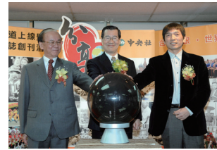
97年12月30日，中央社政府資訊頻道上線暨《全球中央》雜誌創刊酒會，副總統蕭萬長（中）與會。