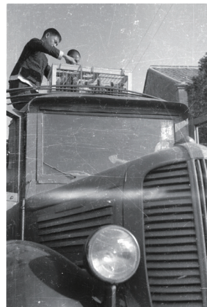
28年1月1日，中央社同仁由桂林至重慶，搬運中央社信鴿。