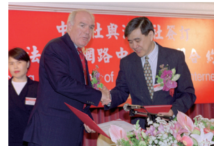
89年10月17日，與法新社簽訂網路版中文新聞協約，左為法新社亞太區總裁雷梭，右為中央社社長汪萬里。