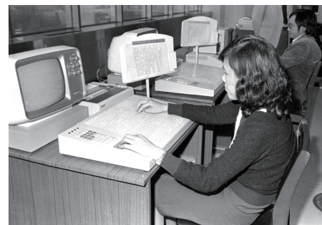
72年4月1日，中央社慶祝59週年社慶，正式啟用中文電腦發佈國內新聞。